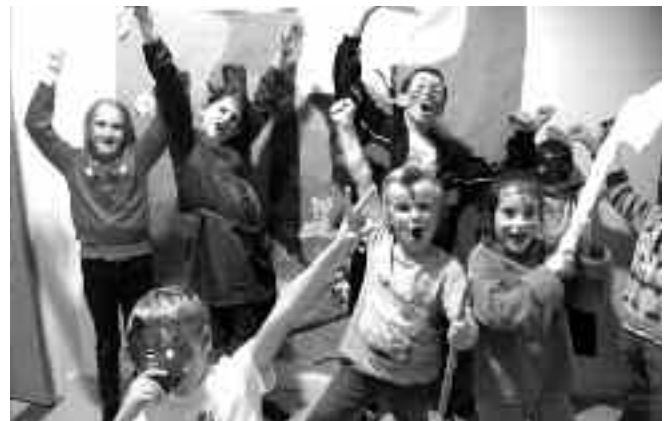
Les petits acteurs en herbe

Lors des accueils du matin et du soir, mais aussi sur les pauses méridiennes, des vocations se dévoilent : hip-hop, ateliers de lecture, jeux coopératifs, bricolages et décorations, percussions, cycle rugby, conteurs de rue... La traditionnelle représentation de Noël du Secteur Enfance a accueilli cette année le spectacle « Un cadeau pour Lola ». La salle de la Durande était remplie d'émotion et d'émerveillement.