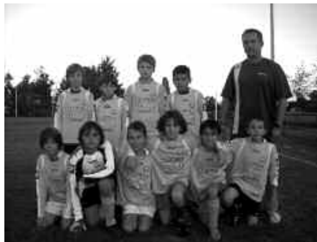
Équipe des U10-U11