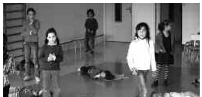
Les grands racontent une histoire aux plus petits