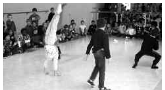
Le monde à l'envers ? Non le Hip-Hop c'est renversant !