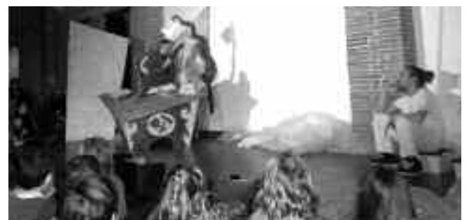
Un cadeau pour Lola