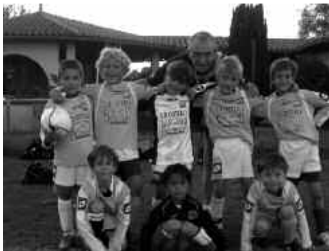
Équipe des U8-U9

Vous pouvez contacter le club au 06 80 59 31 49. Site internet www.coc-football.fr si vous souhaitez nous rejoindre.